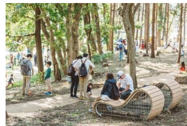
▲既存樹林を活かした鶴間公園樹林エリア

心身ともに健康になる公園の有り様を探求。2つの広場や里山の風景が残る樹林エリア、ケヤキ並木が象徴的な水道道路などの要素構成はそのままに、ひとつひとつの設えを丁寧に見直すリノベーションを図り、子どもからシニア層まで多世代が思い思いに過ごせる、滞在性・活動性の高い公園として再編した。