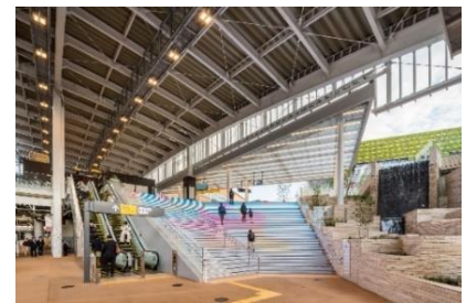
▲まちと一体感のある鉄道駅舎

まちの玄関口となる駅舎は、駅南北の往来を可能とする自由通路の架設やホームドアの設置などによる安全性の向上に加え、ホームからまちへと繋がる大階段や植栽、滝の演出などにより、駅に降り立った瞬間からまちの高揚感を感じられる設えとしました。