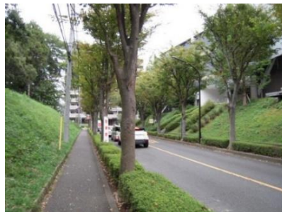
▲南1604号線※2018年6月に廃止