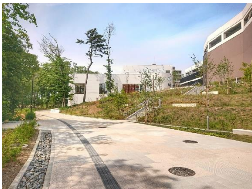
▲公園と商業をつなぐパークライフ・サイト内歩行者通路