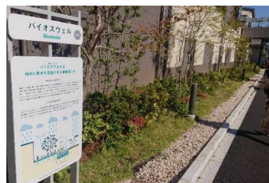
▲雨のみち: バイオスウェル

調整池や雨水貯留槽などの従来型の雨水流出抑制策に加え、自然環境が有する機能を活用するグリーンインフラを採用。敷地周辺を囲むように石を敷き詰めた隙間の多い溝状の「雨のみち: バイオスウェル」と、くぼ地状の植栽帯である「雨のにな: レインガーデン」をランドスケープのデザインへ取り込みました。