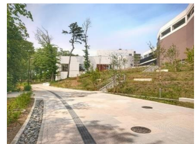
▲パークライフ・サイト内歩行者空間