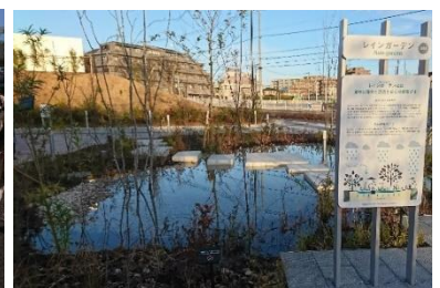
▲雨のにな: レインガーデン