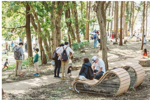
▲既存の樹林を活かし再編した鶴間公園

本プロジェクトは、田園都市線「南町田グランベリーパーク駅」(2019年10月1日に「南町田駅」から改称)南側に広がる鶴間公園と2017年2月に閉館したグランベリーモール跡地を中心とする約22haのエリアについて、官民が連携し、都市基盤・商業施設・都市公園・駅などを一体的に再整備・再構築し、「新しい暮らしの拠点」の創出に取り組むまちづくりプロジェクトです。