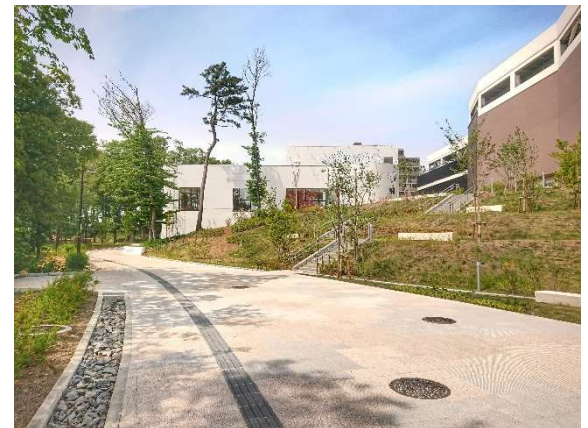
▶(右)商業施設と公園をつなぐ歩行者空間