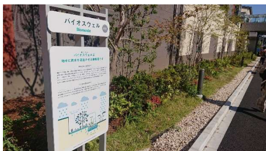
▲雨のみち:バイオスウェル

調整池や雨水貯留槽などの従来型の雨水流出抑制策に加え、自然環境が有する機能を活用するグリーンインフラを採用。敷地周辺を囲むように石を敷き詰めた隙間の多い溝状の「雨のみち:バイオスウェル」と、くぼ地状の植栽帯である「雨のにわ:レインガーデン」をランドスケープのデザインへ取り込みました。