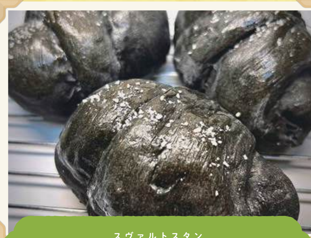
スヴァルトスタン Svart Stang

パンから自家製のバインミー研究家のお店。イチ押し「豚焼肉のバインミー」は、ベトナムの調味料で味付けし、豚焼肉とオリジナルのなますの酸味がクセになる美味しさ!