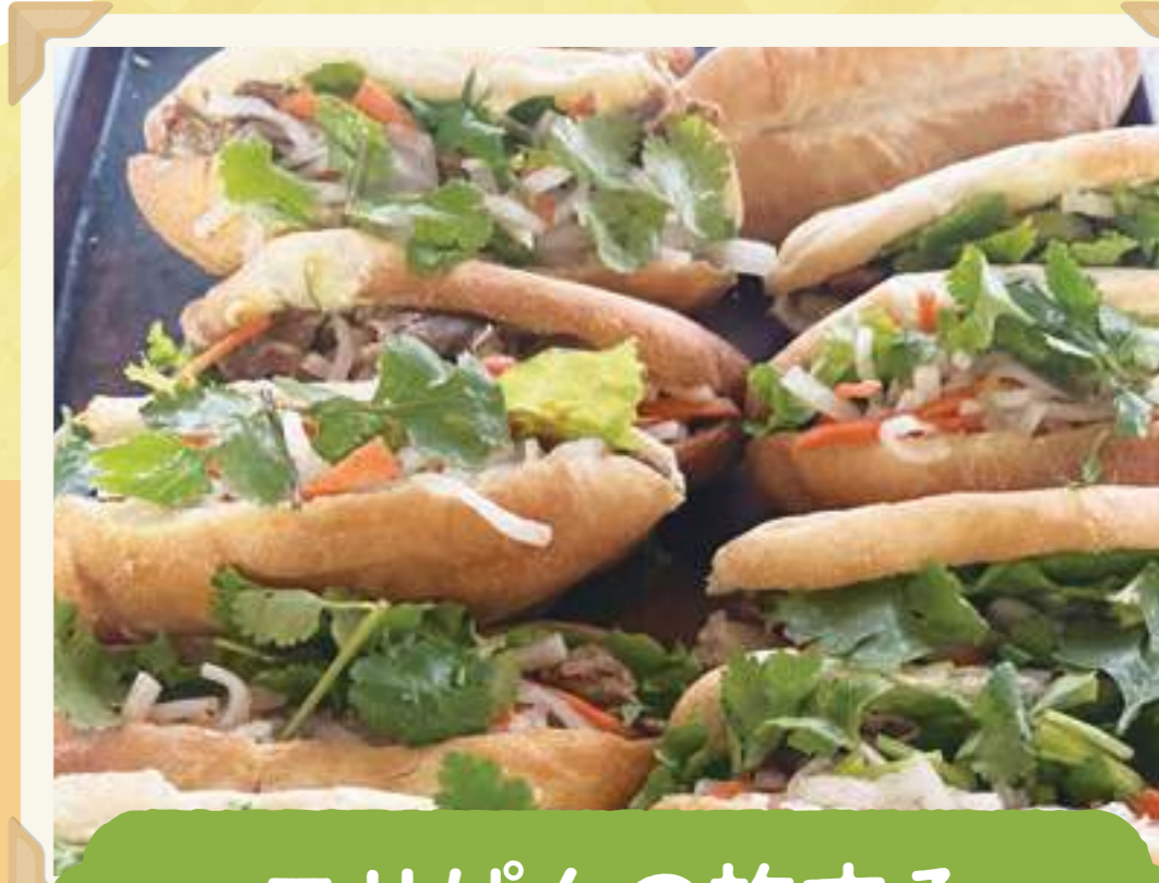
エリぱんの旅する バインミー

麴の天然酵母で16時間発酵させたパンは腸活にも◎人気の「インドカレーパン各種」は、天然スパイスのインドカレーを入れ、サクッとした食感も最高!